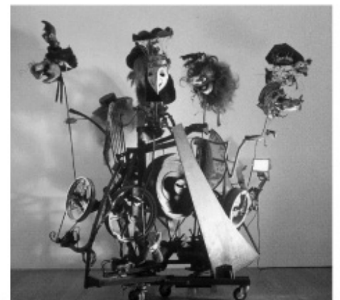
L'Avant Garde Jean Tinguely 1988 Don de Niki de Saint Phalle Musée Jean Tinguely