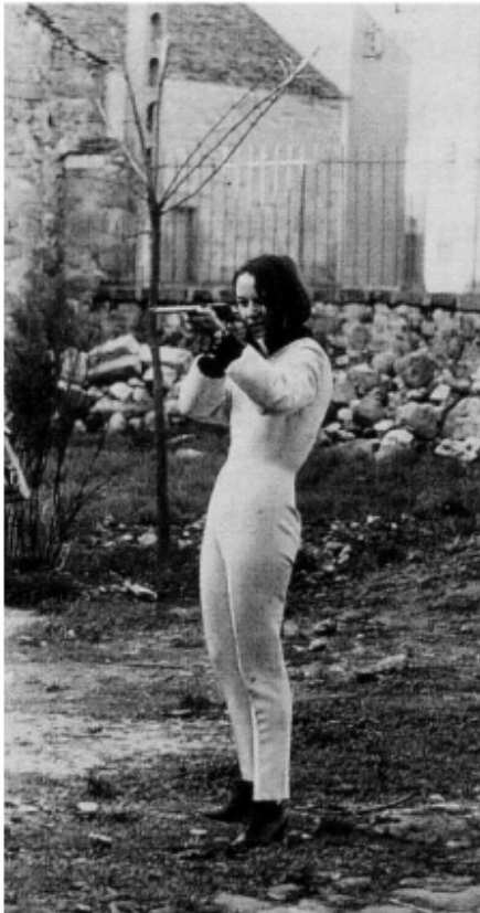
Niki de Saint Phalle en train de tirer 0 Soisy-sur-Ecole 1963. Période des oeuvres "fusillades"

Niki de Saint Phalle et Jean Tinguely lors des travaux de préparation du Dylaby au Stedelijk Museum d' Amsterdam 1962 (cible, un homme, en perçant des boudruches pleines de peinture !), sculptures aussi, comme cette jeune mariée immaculée emportée par un cheval monstrueux fait de jouets d'enfants et d'armes. Ou encore cette femme, le ventre ouvert, avec le fœtus qu'un dragon s'apprête à dévorer alors qu'un avion décharge son tapis de bombes à proximité ! Drame d'une jeune femme qui abandonna