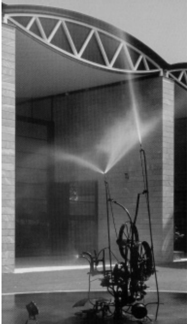
Musée Jean Tinguely Bâle

A l'appui, il cite Oscar WILD "je peux résister à tout sauf à