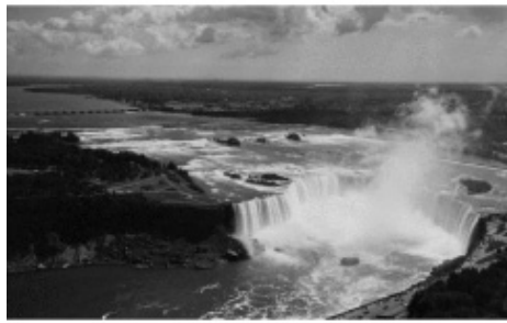
Les chutes côté canadien