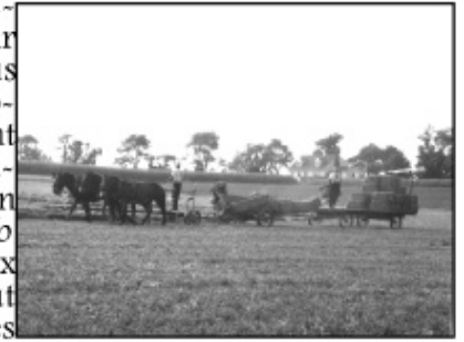
Les regains chez les Amish

Il y a une autre Amérique au delà des clichés et des images que nous véhiculons en nous depuis des lustres. En bref, ce fut la découverte bien réelle d'un Nouveau Monde