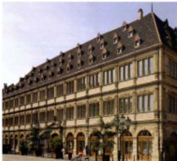
La vénérable chambre de commerce de Strasbourg