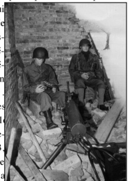
Une présentation très réaliste

eurent l'idée de ce musée mais leurs fils ( parmi lesquels le fils de notre secrétaire )! Par "devoir de mémoire " pour la population et les jeunes en particulier . Cela commence par des collections personnelles puis, rassemblées elles deviennent un musée en 1993. Une fois acquis le local que la mairie de Turckheim a mis à leur disposition