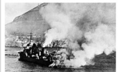
Mers El Kebir: Le contre torpilleur Mogador