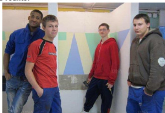
Pour 7 jeunes, 2 éducateurs et 1 secrétaire de l'Institut Mertian : objectif New York

Notre club a fait un don de 500 euros pour leur opération