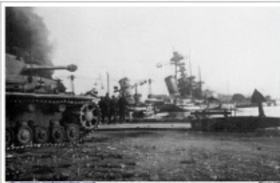
Le Colbert après le sabordage. Char allemand à gauche