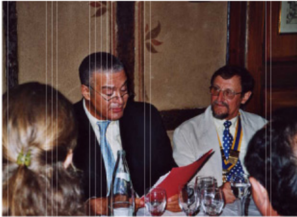
Le consul au cours de son allocution

le sujet à partir d'une actualité particulièrement troublée : guerre en Irak, attentats de Casablanca, attentats en série en Palestine, en lui demandant si nous n'étions pas au coeur du " choc des civilisations, voire du " choc des religions". Mais le consul nous annonça simplement que sa conférence ne porterait pas sur ce sujet !