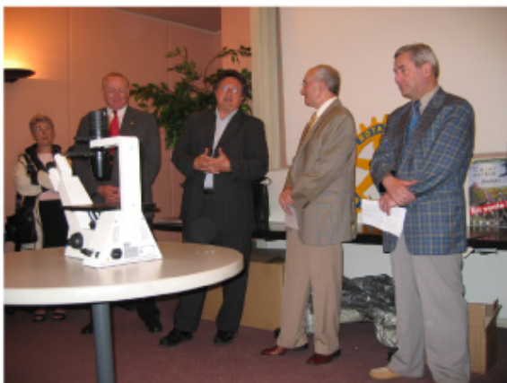
Allocation du P. PINGET

En réalisant ce Guide de l'Alsace Centrale Insolite, le Rotary Club Sélestat Centre Alsace répond à trois objectifs