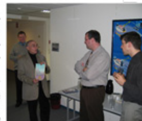
Le président remet le fanion du club

L'impression laissée par cette visite est que nous venons de voir un bel outil de travail, où règne la haute technologie dans des locaux clairs, spacieux, fonctionnels et