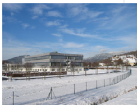
L'usine Bürkert de Triembach sous la neige

siède 4 usines, dont 3 en Allemagne et 1 en France. L'usine de Triembach-au-Val, existe depuis une vingtaine d'années et à été agrandie en 1999, par l'ajout d'une nouvelle aile. La particularité de ces usines, c'est qu'elles sont toutes installées dans des vallées.