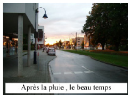
Après la pluie, le beau temps

économique en lien avec le développement durable, formation à l'environnement.