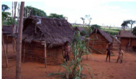
Près de Tuléar à Madagascar